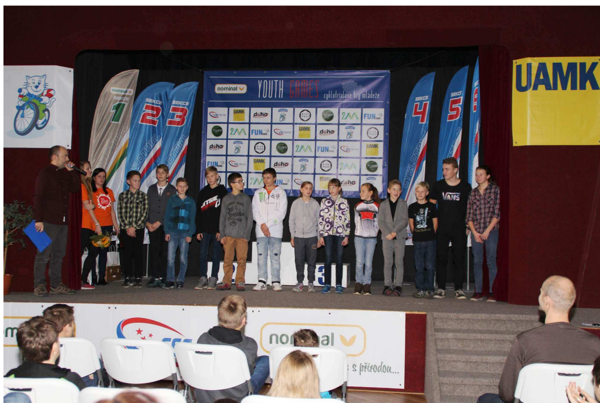
Slavnostní vyhlášení sezony 2016