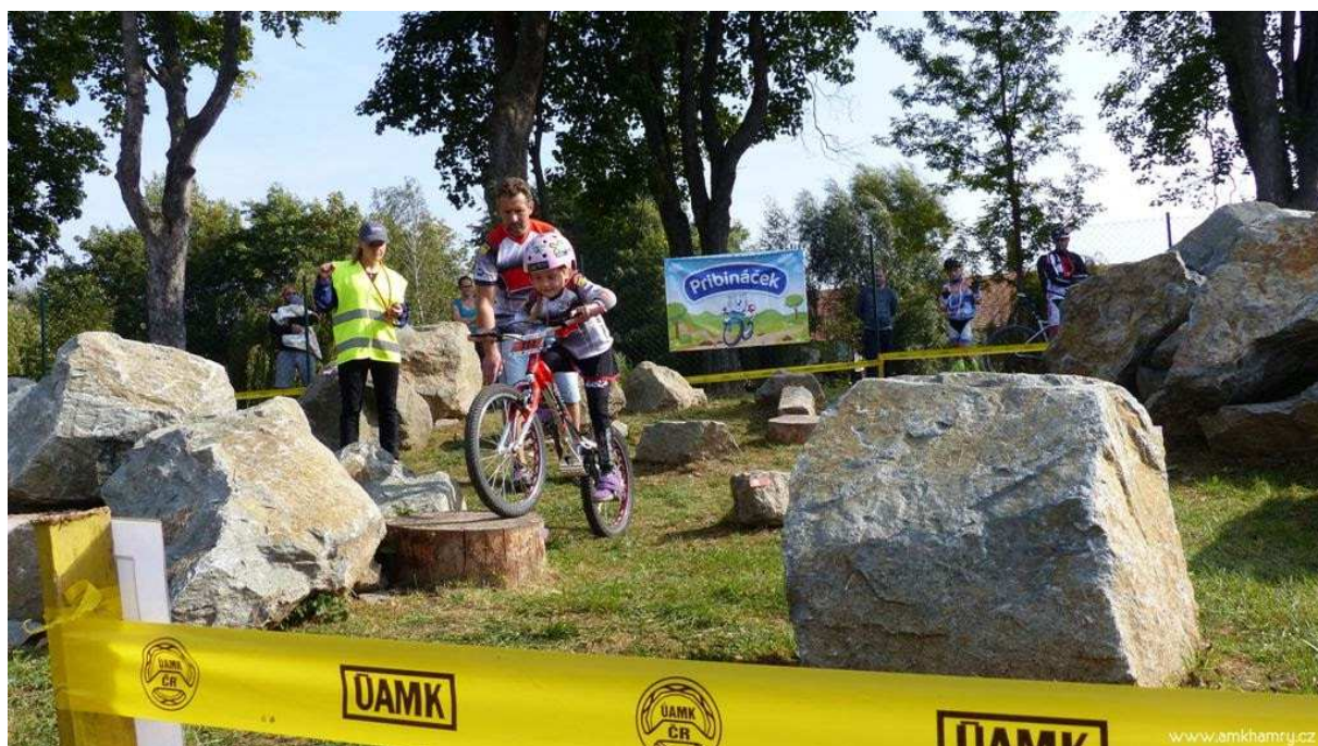
Nejmladší generace, kategorie promesa